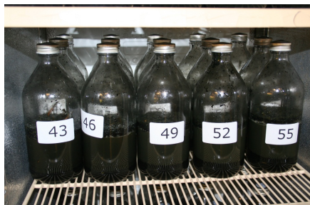
Batchforsøg med hamp, 2011/2012.