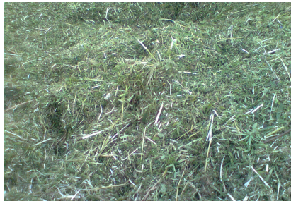
Efterårshøstet biomasse, hamp, 2011.

Den forårshøstede hamp var snittet i begyndelsen af april med en vandprocent på under 15 2) med finsnitter.